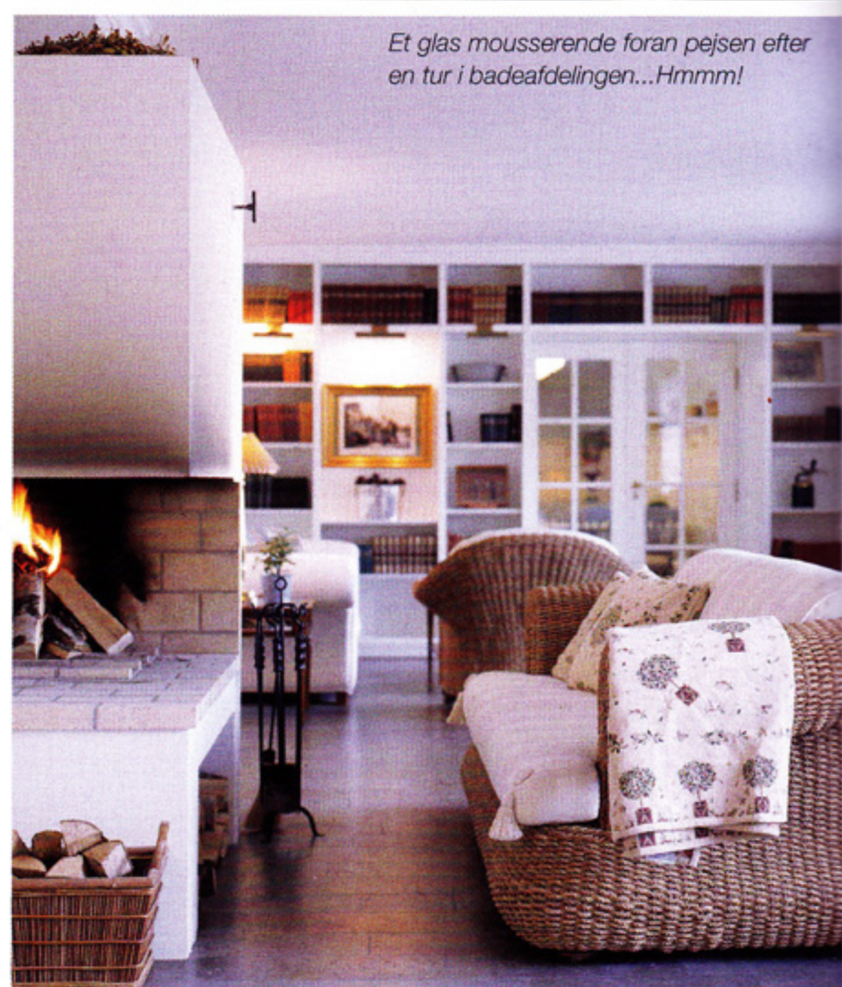
Et glas mousserende foran pejsen efter en tur i badeafdelingen...Hmmm!